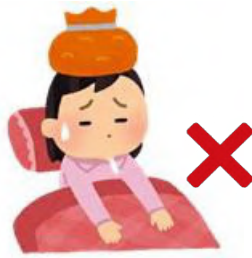
体調不良者は利用不可