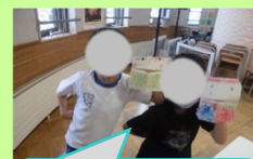
牛乳パックで パクパク人形完成!