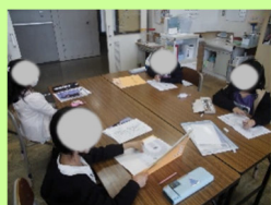
真面目モードで宿題! やればできる!