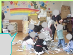
あそびの城で禁断の 新聞紙散らかし放題!

【児童室からのおねがい】 新型コロナウイルス感染拡大防止のため、引き続き、入室前の検温、マスクの着用、替えマスクの用意をお願いします。