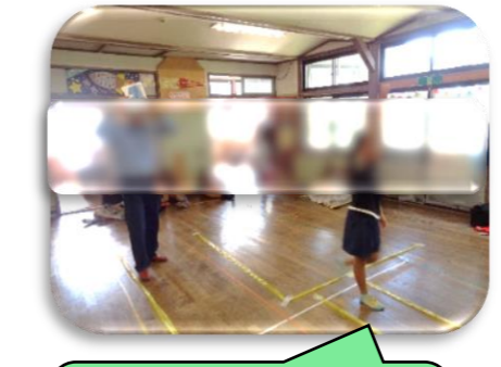
横断歩道を渡っている時、後方からの車に気をつけることも教えてもらいました！