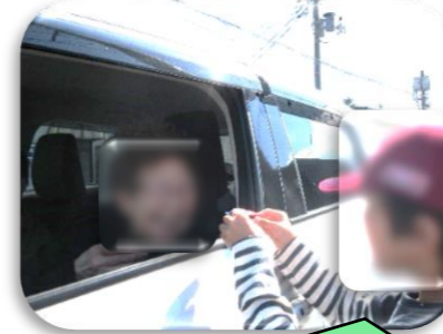
マスコットを渡すと笑顔で受け取ってくれて嬉しかったよ☆