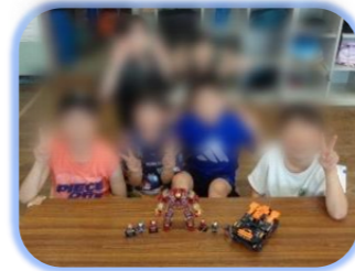
みんなでレゴブロック☆