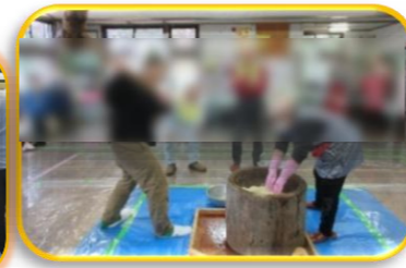
三世交代交流もちつき会